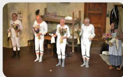
Slavnostní křest Cimrmanovy rané, Nový Bydžov 19. 10. 2013